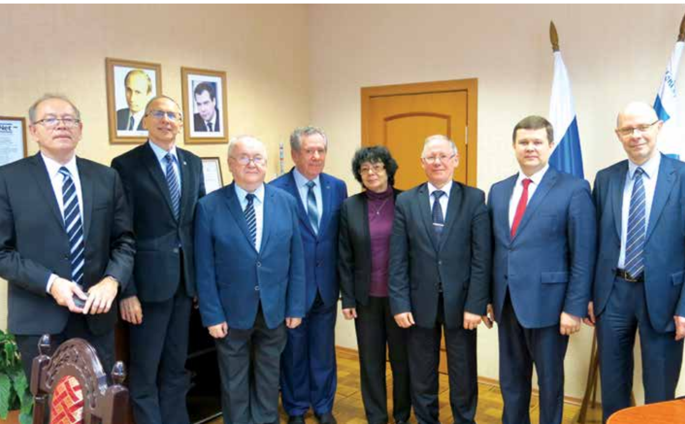
Delegacja z PŁ. na spotkaniu z władzami NovGU