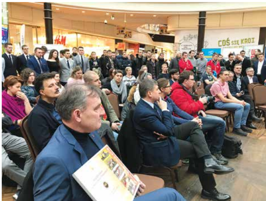
Prezentacja cieszyła się dużym zainteresowaniem