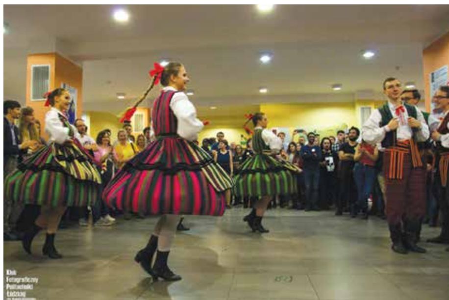
W czasie International Dinner and Dances Connecting People

Była to już ósma edycja Mobility Week i jak zawsze obfitowała w wiele atrakcji. Celem Mobility Week jest nie tylko zachęcenie studentów uczelni do mobilności i wzbudzenie w nich ciekawości świata, ale również podkreślenie, że Politechnika Łódzka to uczelnia otwarta na studentów zza granicy.