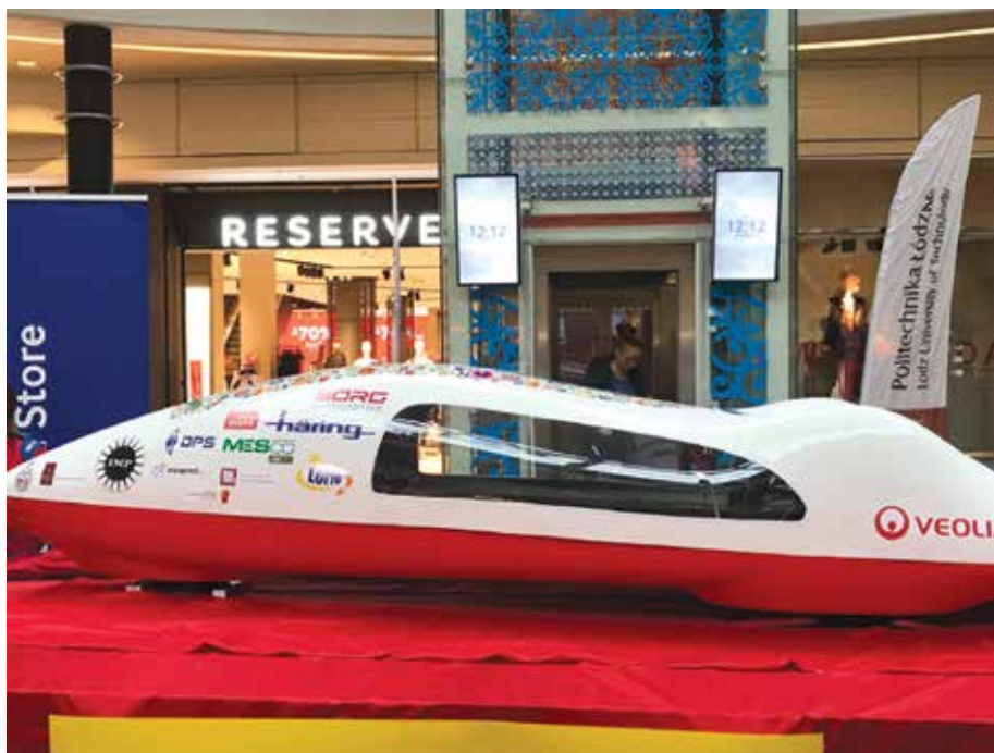
Premierowa odsłona bolidu Eco Arrow 3