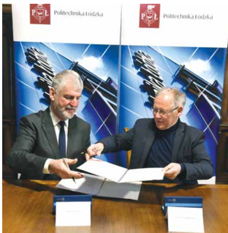
Podpisanie umowy otwiera nowe możliwości współpracy