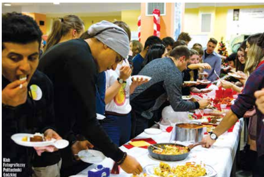
Degustacja dań z różnych stron świata

Tegoroczny Mobility Week, zorganizowany przez Sekcję Mobilności Studenckiej Centrum Współpracy Międzynarodowej PŁ, składał się z czterech wydarzeń głównych – Inauguracji na Sportowo, Kawiarenki Erasmusa, Erasmus Talent Show oraz, tradycyjnie już, International Dinner and Dances Connecting People. Ta ostatnia impreza, podsumowująca cały tydzień atrakcji, to niezwykle wieczór, w którym udział biorą studenci i pracownicy PŁ. Wydarzenie łączy degustację dań kuchni międzynarodowej i naukę tańców z różnych stron świata. W tym roku na temat części tanecznej wybra-